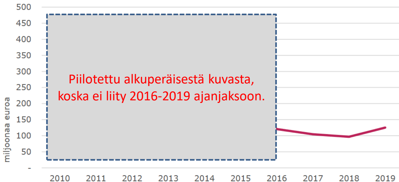
Kuva 12. Laskennallinen keskeytyksistä aiheutuva haitta vuosina 2010–2019